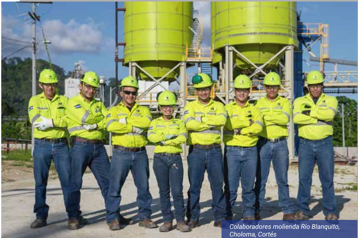
Colaboradores molienda Río Blanquito, Choloma, Cortés

Nuestro marco de actuación y autorregulación está regido por los principios corporativos de Cementos Argos Honduras, dada nuestra naturaleza como fundación empresarial de esta compañía. De esta manera tenemos la firme convicción de que la ética y la transparencia son fundamentales y no negociables y orientamos nuestra actividad de acuerdo con nuestro principio inspirador: la integridad.