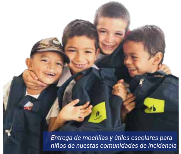
Entrega de mochilas y útiles escolares para niños de nuestras comunidades de incidencia

Desarrollamos y aportamos en la mejora de las competencias y habilidades asociadas a la calidad educativa de nuestras comunidades. Esta línea la ejecutamos anualmente con la entrega de mochilas con útiles escolares para los niños de nuestras comunidades de incidencia. Asimismo, a través de nuestro programa de becas, impulsamos la formación integral de jóvenes de las comunidades facilitando su acceso a la educación superior y fortaleciendo sus capacidades de liderazgo y sentido de pertenencia hacia sus territorios.