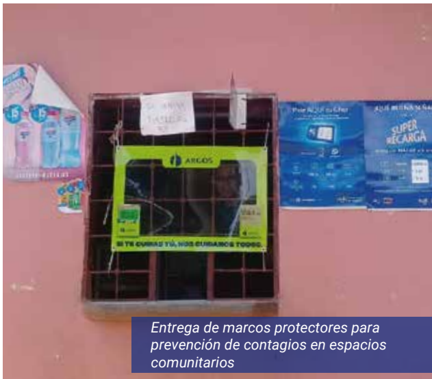
Entrega de marcos protectores para prevención de contagios en espacios comunitarios