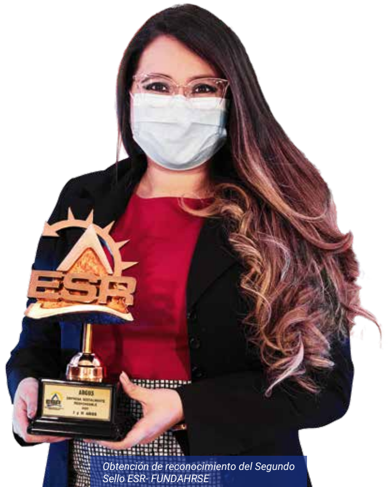
Obtención de reconocimiento del Segundo Sello ESR-FUNDAHRSE

Por segundo año consecutivo fuimos reconocidos por la Fundación Hondureña de Responsabilidad Social Empresarial (FUNDAHRSE) con el Sello de Empresa Socialmente Responsable (ESR) por nuestras buenas prácticas en lo económico, social y ambiental.