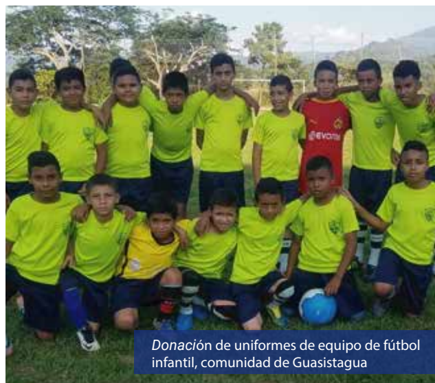
Donación de uniformes de equipo de fútbol infantil, comunidad de Guasistagua

Contribuimos a fortalecer aquellos aspectos que hacen parte de la identidad de las comunidades y aportan a la construcción de tejido social. En el año 2020, apoyamos el deporte en nuestras comunidades con la donación de uniformes e implementos deportivos, así como ferias culturales virtuales derivadas por la pandemia.