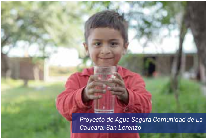
Proyecto de Agua Segura Comunidad de La Caucara, San Lorenzo