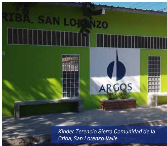
Kinder Terencio Sierra Comunidad de la Criba, San Lorenzo Valle

Fuimos parte de los sueños de los niños que inician su etapa escolar. Contribuimos con el mejoramiento del espacio físico del Kinder Terencio Sierra de la comunidad de La Criba en San Lorenzo Valle, logrando de esta manera proporcionar un ambiente escolar adecuado que permita la creatividad y el deseo de aprender en los niños. Este proyecto fue construido en alianza con la Fundación para el Desarrollo de la Zona Sur (FUNDESUR) contribuyendo de esta manera al mejoramiento de la infraestructura escolar en dicha comunidad.