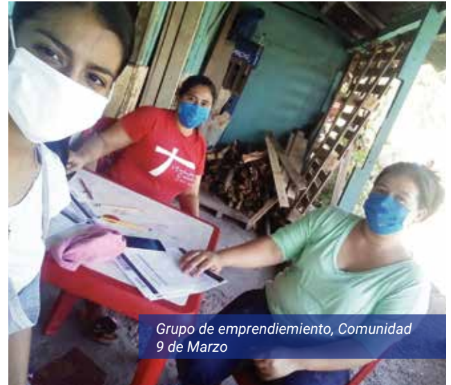
Grupo de emprendimiento, Comunidad 9 de Marzo

En la próxima fase del programa que se desarrollará en 2021, iniciaremos con la entrega de capital semilla a los emprendimientos beneficiados, así como el monitoreo y acompañamiento que permitirá posteriormente proveerles capital de crecimiento.