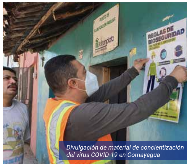
Divulgación de material de concientización del virus COVID-19 en Comayagua

Apoyamos a nuestros grupos de interés con la entrega de elementos de protección personal e higiene así como aportes de recursos para la dotación de centros de salud y hospitales con el fin de garantizar la atención oportuna para los enfermos de COVID-19. Además, se compartieron buenas prácticas de bioseguridad para prevenir la propagación del virus con diferentes actores de nuestra cadena de valor.